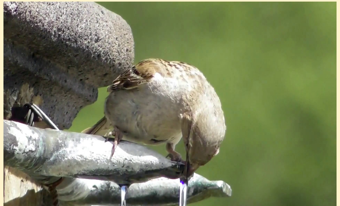
Encore un peu d'eau pour les piafs