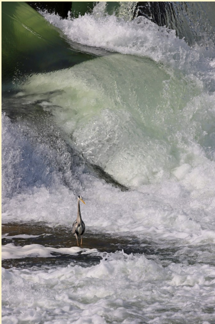
Submersion, quand l'eau vitale peut nous surprendre